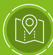
Goede ruimtelijke ordening

Nieuw openbaar onderzoek is nodig als wijziging: