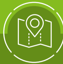
Goede ruimtelijke ordening